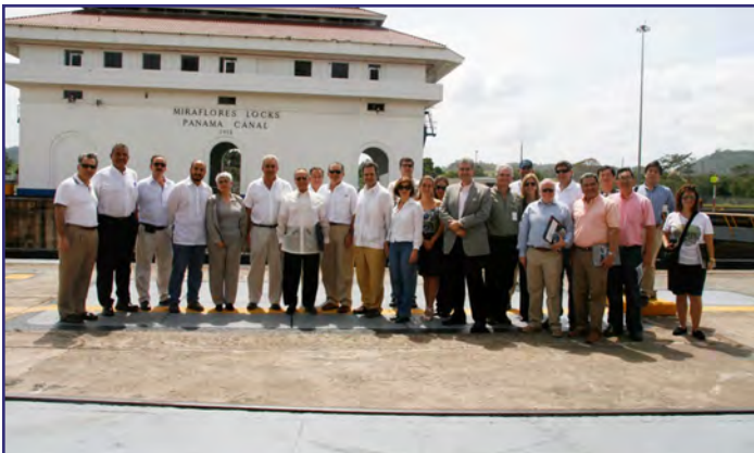
Panama Maritime y visita a la zona de expansión del Canal de Panamá. Panamá del 13 al 16 de febrero.