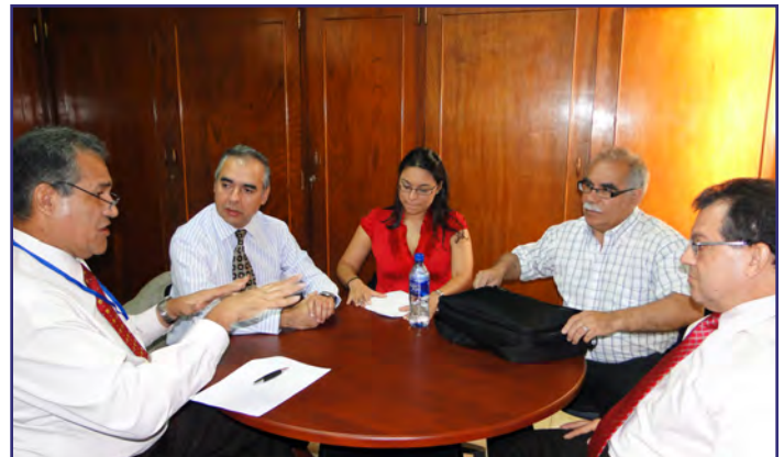
Reunión Consorcio INECOM, Sede COCATRAM, Managua 28 de noviembre 2011.