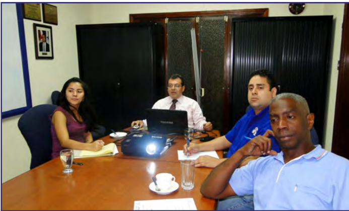
Reunión Equipo Consultores Rutas Marítimas del Gran Caribe - Fase II. Managua, Nicaragua del 17 al 19 mayo.