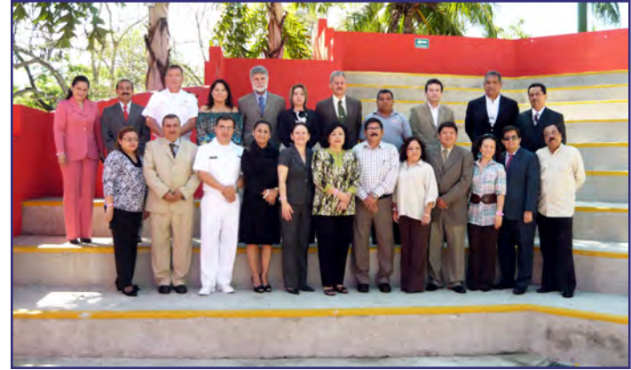
Reunión Anual de Red de Centros de Capacitación Marítimo Portuaria. San Salvador, El Salvador del 1 al 3 de marzo.