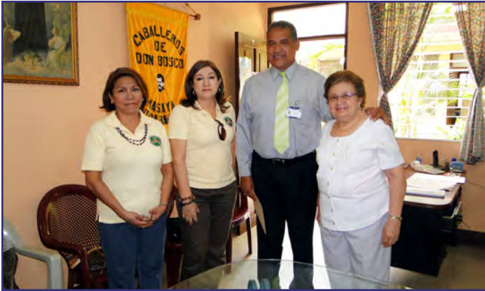
Donación y entrega de mobiliario y equipos de oficina a la Asociación de Damas Salesianas, Masaya 31, marzo 2011.