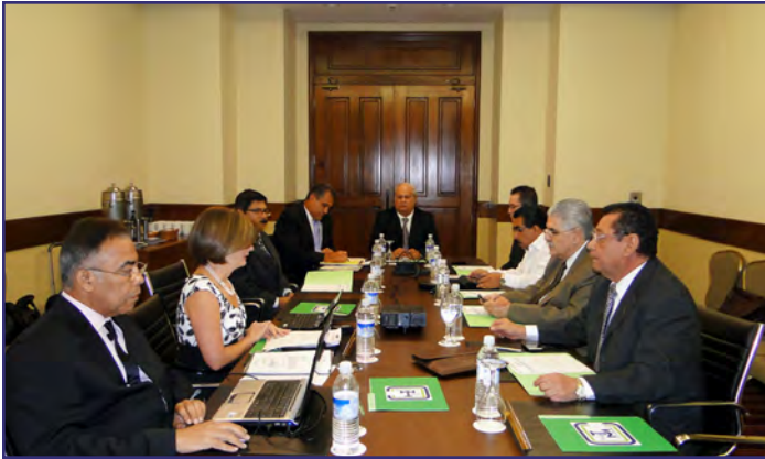
XXXVI Reunión Extraordinaria del Directorio, rotación Presidencia Pro Tempore de COCATRAM. Managua, Nicaragua, 14 de enero.