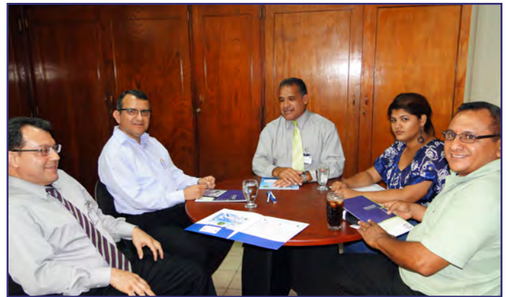
Visita OSPESCA, Sede COCATRAM. Managua, 20 de mayo 2011.