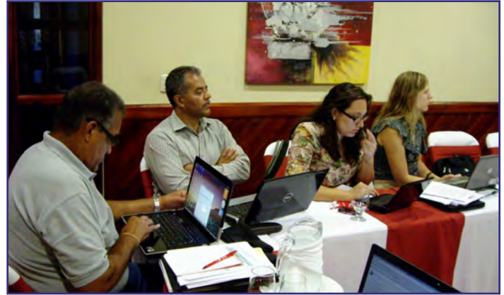
Evaluación Técnica GEF, Puerto Cortés, Honduras, 05 de abril 2011.