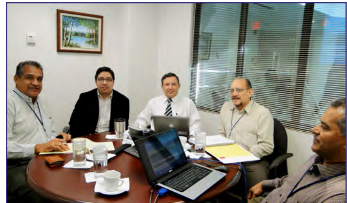
Reunión BID - Honduras, Tegucigalpa Honduras, 25 de marzo 2011.