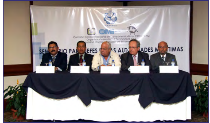
XVIII ROCRAM-CA. San Salvador, El Salvador, 3 y 4 de febrero.