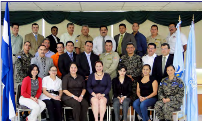
Seminario Taller para Elaborar Plan de Contingencia. Tegucigalpa Honduras, 22 de marzo 2011.