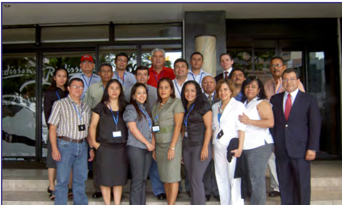
Reunión Anual Red de Estadísticas Portuarias de Centroamérica. Ciudad de Guatemala, Guatemala del 16 al 17 de junio.